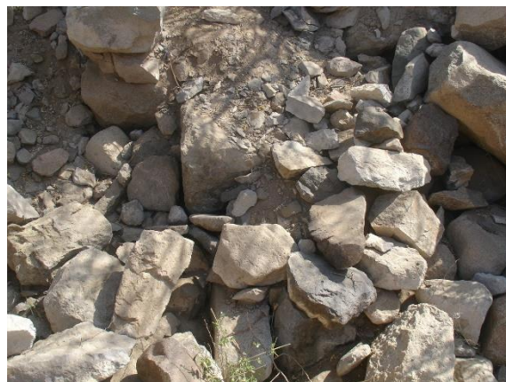
صورة لنفس الجزء الغربي للموقع تظهر بعض الأساسات.