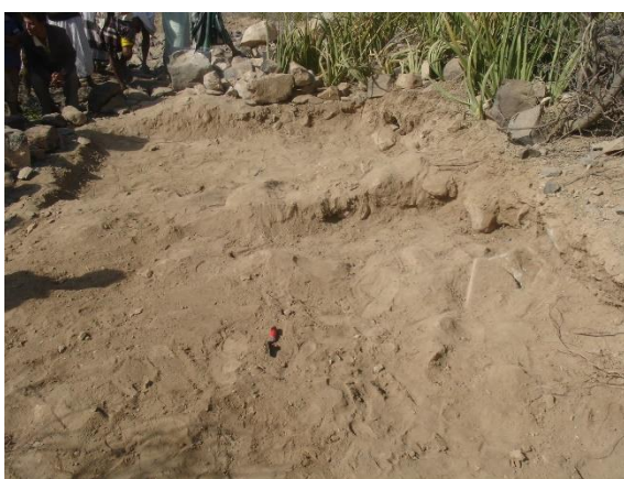
المربع رقم (١) الطبقة (صفر).