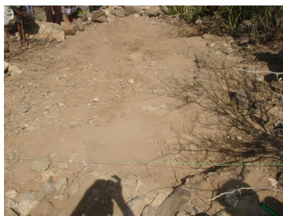
المجس (المربع) رقم (١) بعد تنظيف سطح المربع.