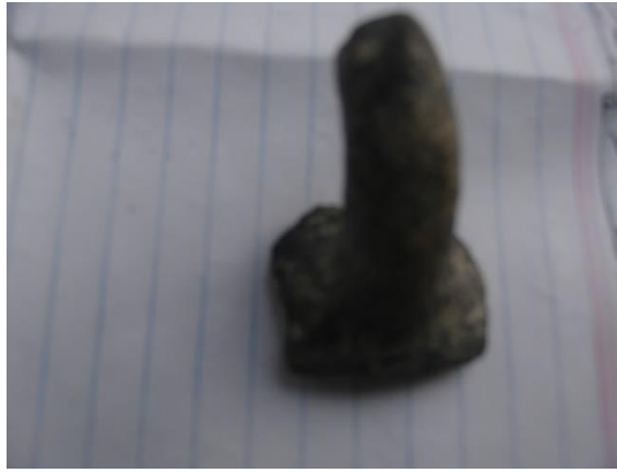
مقبض آنية من الفخار الأسود. (المربع رقم (١))