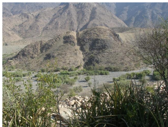
صورة توضح مكان أو موضع السد القديم على وادي النحر شمال شرق الموقع.