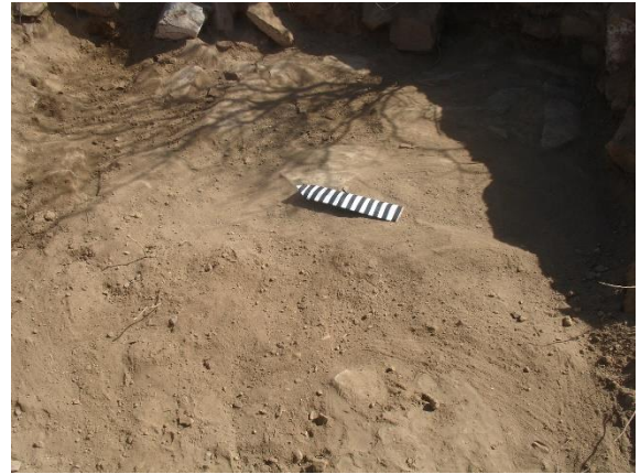
الركن الجنوبي لشرقي للمربع (١).