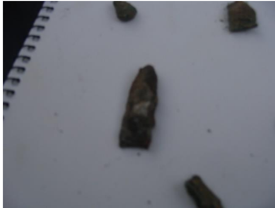
رأس سهم من الحديد من نفس المجموعة السابقة.