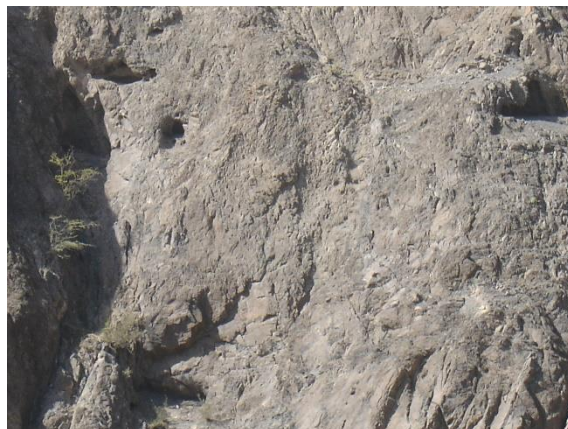
جبال الحقيبة غرب الموقع والمطل على وادي اللحم الذي يفصل بينها وبين الموقع ويظهر بعض الكهوف (ربما تمثل مقابر صخرية)