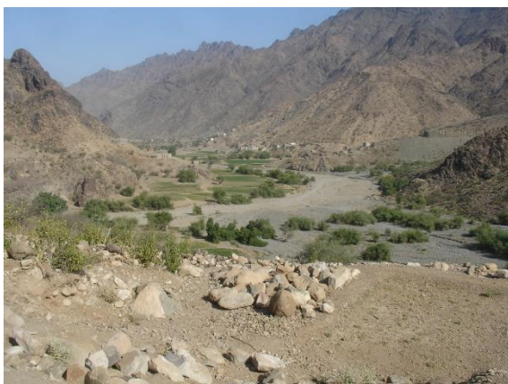
وادي سير شمال الموقع.