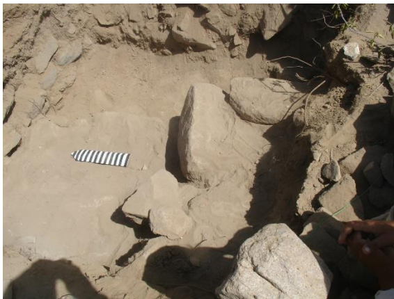
المربع رقم (٢) الطبقة (١) وتوضح بداية ظهور الجدار الذي يقسم المربع إلى جزئين ويمتد من الشمال إلى الجنوب..