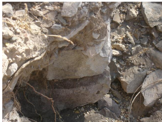
أحد المباني في نفس الجزء السابق من الموقع وتبدو جدران وأساسات مبنى تعرض للنهب في الفترة القريبة الماضية.