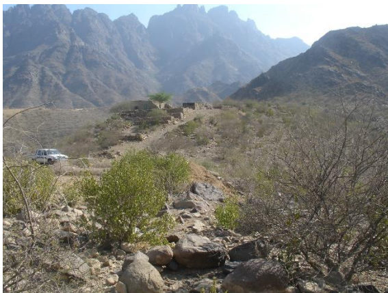
الجزء الأوسط للموقع (حبيل العرمة) وهو الجزء المنخفض من الموقع.