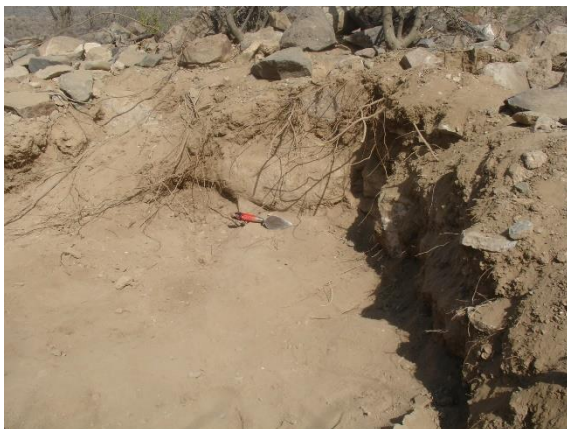
المربع رقم (١) الطبقة (١).