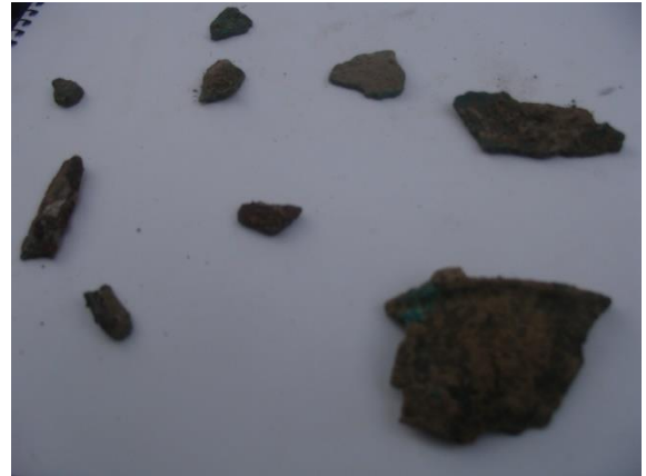
مجموعة كسر برونز وحديد منها جزء من آنية من البرونز (الطبقة (١) المربع (١)).