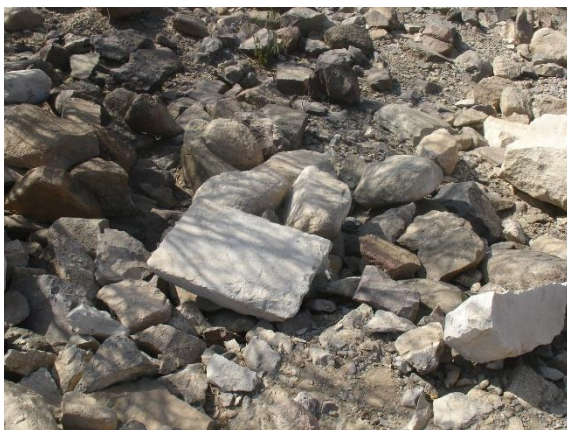
صورة من نفس الموقع وتظهر نوع أحجار البلاط الخاصة بالمبنى السابق المنبوش.