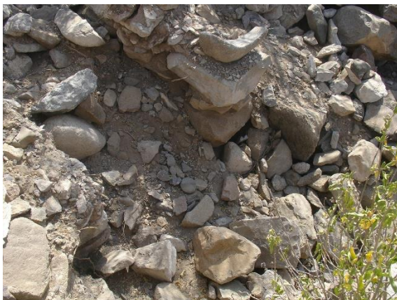
الجزء الغربي من الموقع (حبيل العرمة) وهو الجزء الذي لا يزل يحوي الكثير من المباني والأساسات والكسر الفخارية والحجرية المتنوعة وربما يمثل هذا الجزء موقع المباني السكنية.