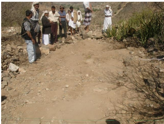
المجس (المربع) رقم (١) بعد تنظيف سطح المربع.