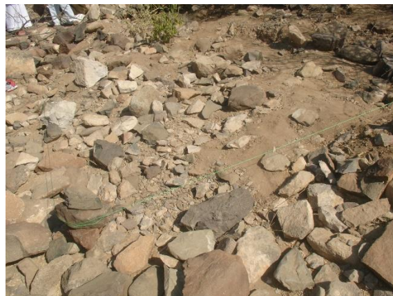
المجس (المربع) رقم (١) قبل الحفر.