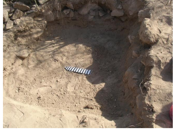
المربع رقم (١) أرضية الطبقة (١) وهي الأرضية الأساسية.