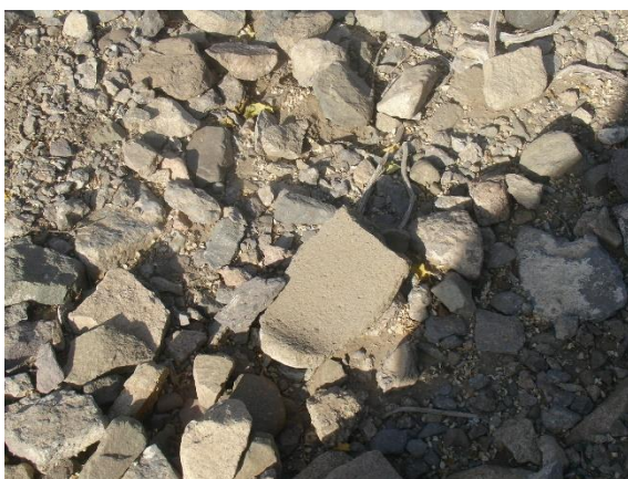
صورة توضح بعض الأحجار وجزء من رحي مكسور.