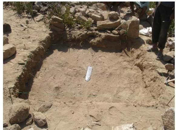
المربع رقم (٢) الطبقة (١).