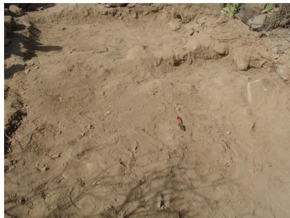
المربع رقم (١) الطبقة (صفر).