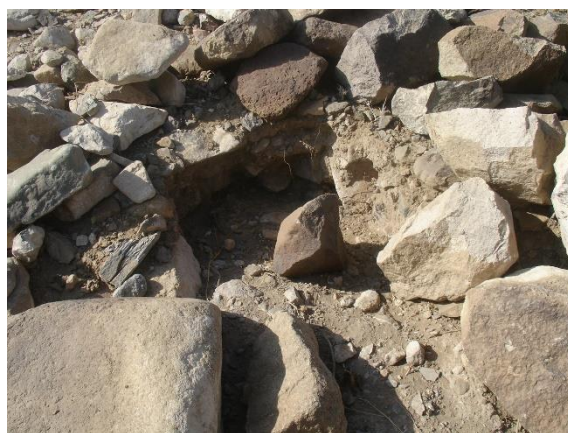
صورة توضح أعمال النباش العشوائي الذي تعرض له الموقع سابقاً.