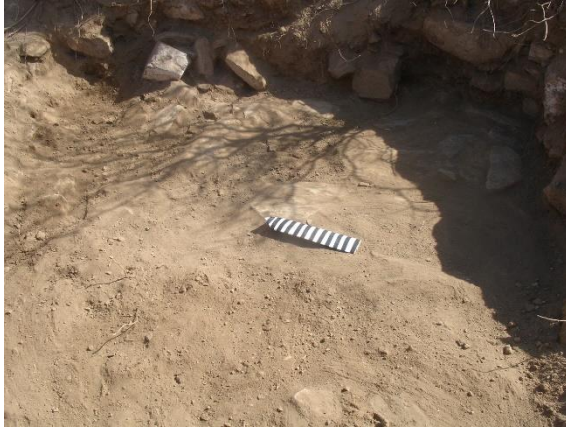
الركن الجنوبي لشرقي للمربع (١) ويظهر بقايا من بلاط الأرضية.