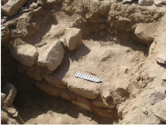
الجزء الغربي من المربع (٢) يبدو انه مكان السلم (الدرج).