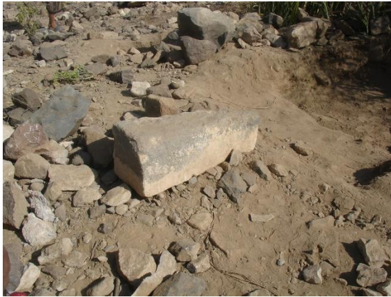
صورة لبعض الأحجار المهندمة التي كانت للمبنى الذي كان قائماً في موقع المربع (١).