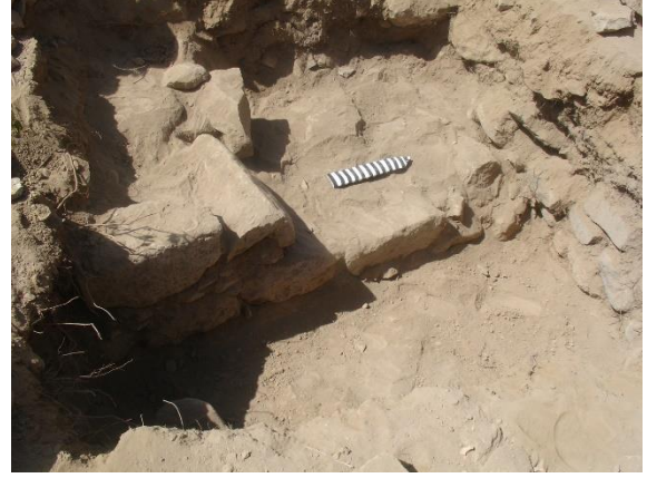
صورة لنفس الجدار بعد ظهور المدمك الثاني.