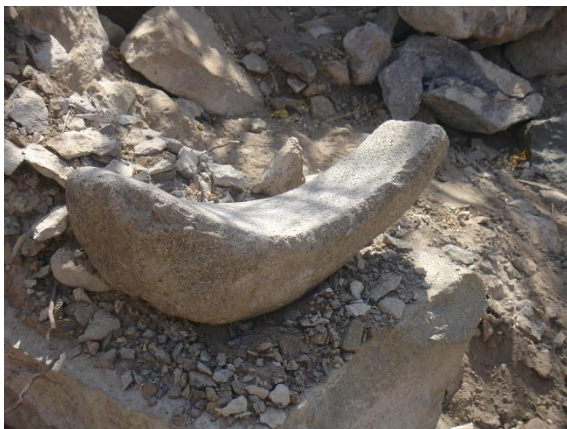
نفس المبنى وتظهر حجر رحي طويلة نوعاً ما ومكسورة من احد طرفيها.